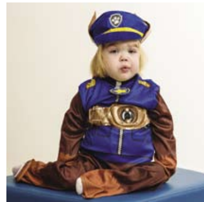
Taika-osaston pieni Ryhmä Haun ”Vainu-koira”