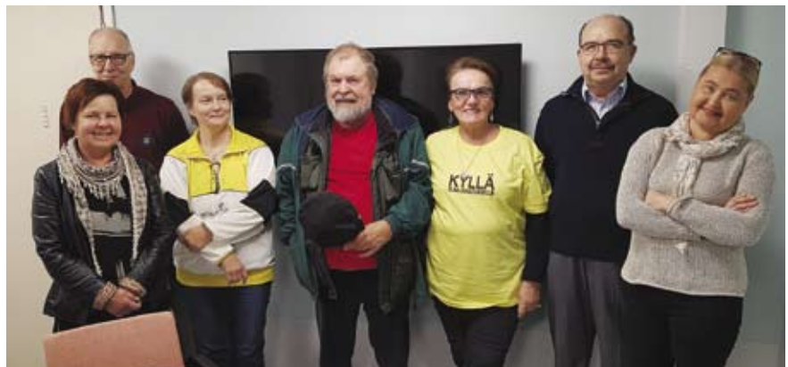
Jäsentapaamisessa juttu luisti ja nauru hersyi. Yhteiskuvakin muistettiin ottaa vasta tilaisuuden päättyessä, kun osa kahvittelijoista oli poistunut paikalta.