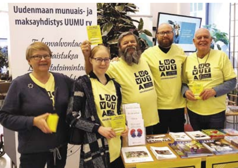
Teemapäivissä on mukava meininki, vertaistukea ja kokemustietoa.

Yhdistyksen asioista ja toiminnasta vastaa hallitus, johon kuuluu tällä hetkellä puheenjohtajien lisäksi kuusi varsinaista ja kuusi henkilökohtaista varajäsentä. Hallitus kokoontuu tarpeen vaatiessa 6–10 kertaa vuodessa. Hallitustyöskentelyssä pääset vaikuttamaan yhdistyksen toiminnan linjauksiin ja kehittämään yhdistyksen toimintaa. Ota yhteyttä UUMU:n toimistolle ja kerro, mikäli olet kiinnostunut päätöksenteosta ja vaikuttamisesta