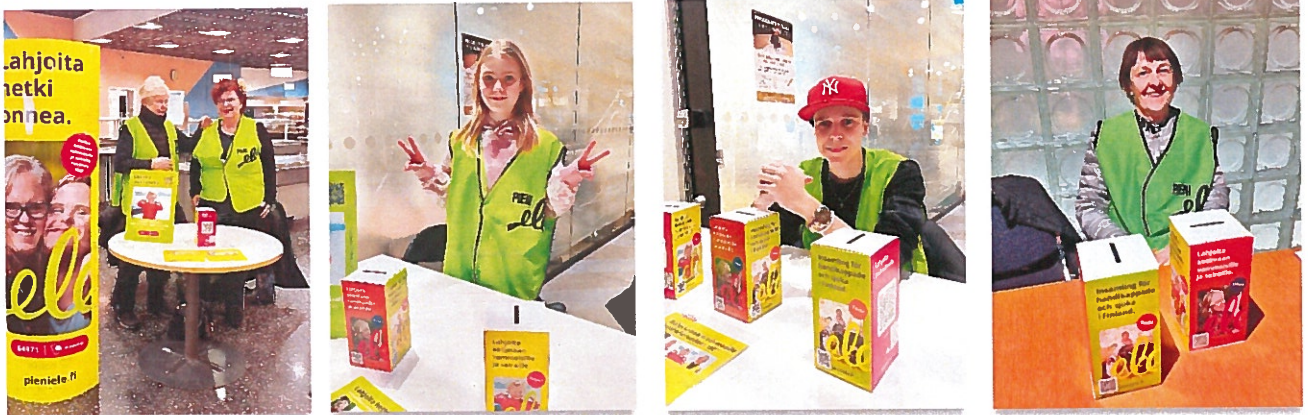
UUMUn Pieni ele -keräjiä äänestyspaikkojen lipaskeräyksissä 2024

Vuonna 2024 pidettyjen EU-vaalien ja presidentinvaalien aikana olleeseen Pieni Ele -keräykseen osallistui 74 henkilöä. UUMUn keräystuotto oli yhteensä 8 551,29 euroa.