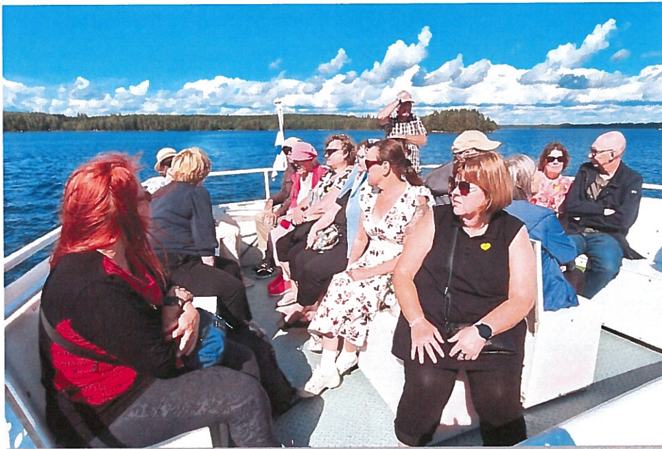
UUMUn jäsenet osallistuivat Etelä-Suomen alueen munuais- ja maksayhdistysten yhteiseen kesäpäivään Imatralla.

Loma-asunto Joutiainen oli koko vuoden ahkerassa käytössä. Käyttöpäiviä oli 290 ja käyttöaste 81 %.