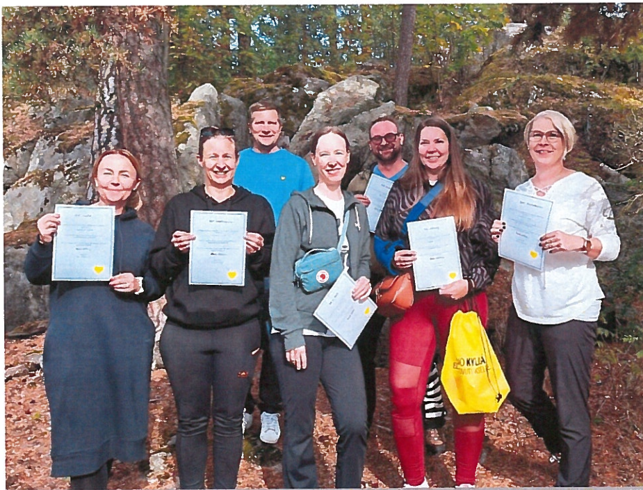
UUMUn vertaisvanhemmat osallistuivat Tampereella 21.-22.9.2024 pidettyyn vertaistukikoulutukseen.

Yhdistyksen jäseniä osallistui KELAn sopeutumisvalmennuskursseille ja STEA-rahoitteisille kuntoutuskursseille sekä Munuais- ja maksaliiton vertaistukitapahtumiin.