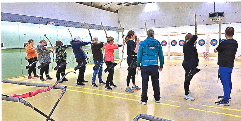
Lokakuun lajikokeiluna käytiin Robin Hood ry:n jousiammuntatunnilla Espoon Tapiolassa.

UUMUn jäseniä osallistui mm. Suomen Keilailuliiton koordinoimiin keilacup-kilpailuihin, Suomen Golfliiton E-Tour erityisgolf-kisoihin sekä Suomen HCP Golfin leireille, harjoituksiin ja kisoihin.