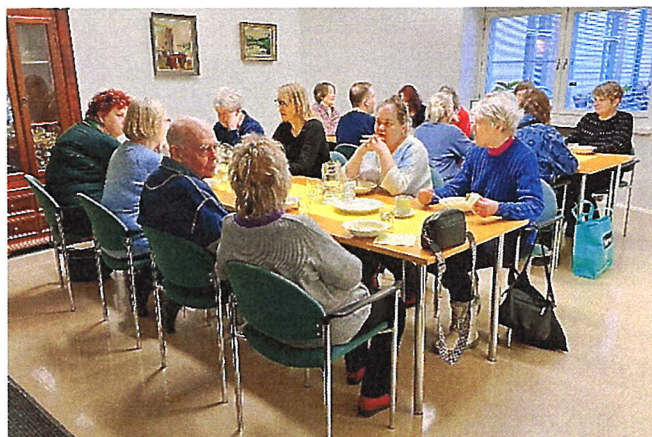
Rokkakekkereillä on aina vilkasta jutustelua.

Loma-asunto Joutiainen oli koko vuoden ahkerassa käytössä. Käyttöpäiviä oli 285 ja käyttöaste 78 %.