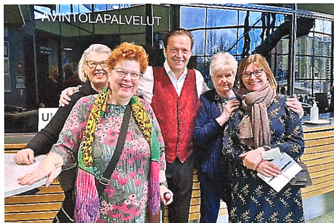
La Strada -konsertissa jäsenet tapasivat myös illan solisti Jyrki Anttilan.