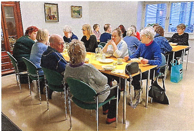
Rokkakekkereillä on aina vilkasta jutustelua.

Loma-asunto Joutiainen oli koko vuoden ahkerassa käytössä. Käyttöpäiviä oli 285 ja käyttöaste 78 %.